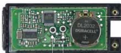
Cilindri di gomma